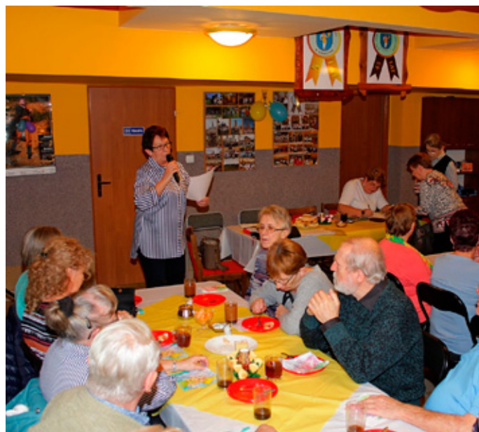
W trakcie referatu sprawozdawczo-programowego.

Na samym początku Nowego Roku 2020, 6 stycznia, odbyło się spotkanie sprawozdawczo-programowe, na którym Zarząd Koła przedstawił sprawozdanie z działalności Koła w II półroczu 2019 roku oraz szczegółowy program działania na rok 2020. Uczestniczyło 100 członków Koła. Zebranych szczególnie interesował bogaty program imprez planowanych na rok 2020.