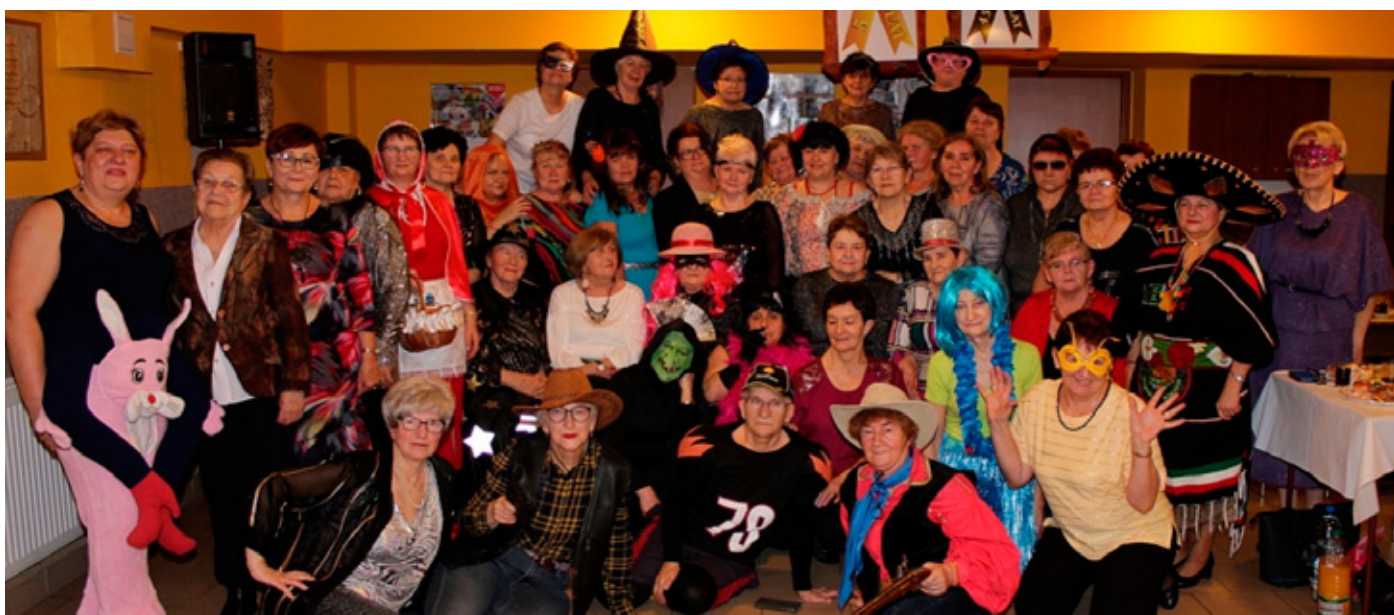
Stroje uczestniczki „babskiego combra” w ujęciu zbiorczym.