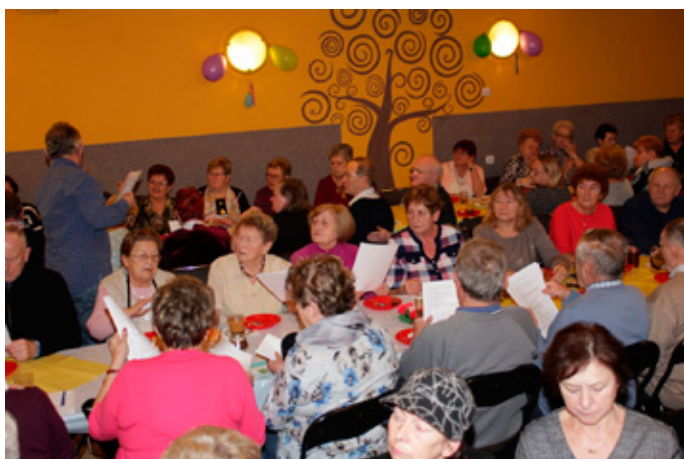
Dyskusja nad programem działania Koła w roku 2020.