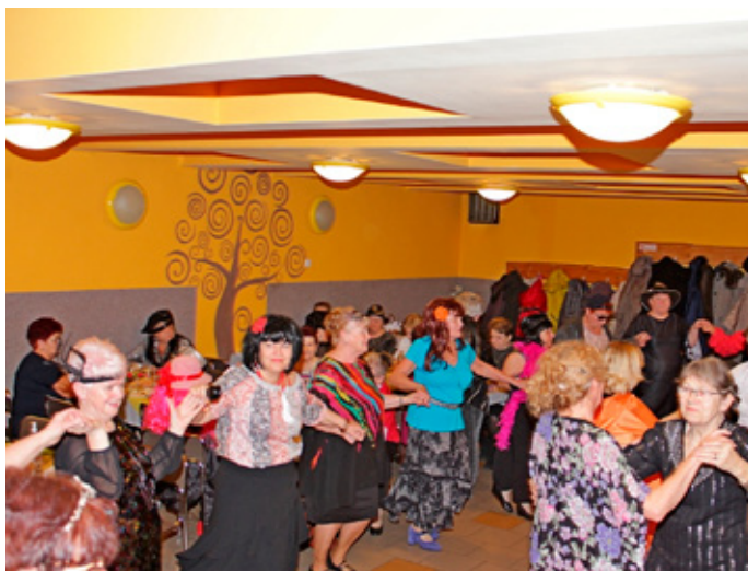
Pląsy naszych Pań na „babskim combrze”.

Najważniejszą imprezą karnawałową był tradycyjny Babski Comber, w którym uczestniczyło 50 naszych Pań. W wymyślnych i pięknych kreacjach bawiły się one przednio, przy skocznej muzyce tanecznej serwowanej przez DJ Jana Burka.