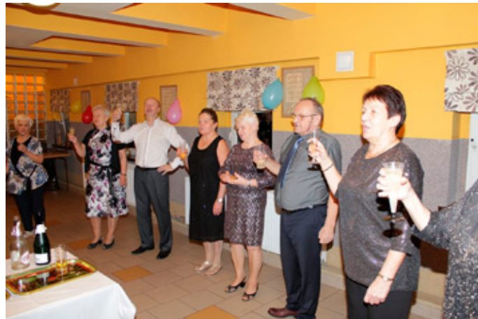
Witamy Nowy Rok 2020!

Ostatniego grudnia około 30 osobowa naszych członków zakończyła rok 2019 z przytupem na zabawie sylwestrowej, otwierając jednocześnie okres karnawałowy 2020 roku. Dopisała nie tylko frekwencja, ale także menu i humory. Uczestnicy wykazali się dużą wytrzymałością fizyczną w tańcach i śpiewach. W Nowy Rok 2020 wszyscy wkroczyli w szampańskim nastroju. Oby nam dopisało zdrowie, a o resztę będziemy zabiegać sami. Mamy nadzieję, że rok 2020 dla członków naszego Koła pod każdym względem będzie tak udany jak 2019.