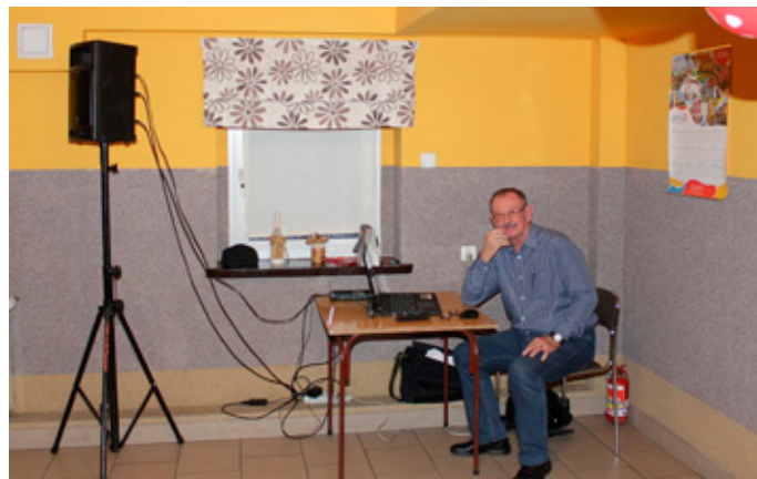
Na tym wyczerpaliśmy kalendarz naszych zimowych imprez. Przed nami wydarzenia sezonu wiosennego.