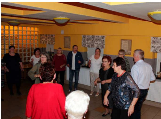
Migawka z zabawy Andrzejkowej.

Sezon zimowy otworzyła zabawa Andrzejkowa, która odbyła się w siedzibie Koła w sobotę, 30 listopada. Uczestniczyło w niej sporo, bo 35 osobowa grupa naszej „młodzieży”. Wszyscy bawili się przednio do samej północy, kiedy to rozpoczął się czas adwentu.